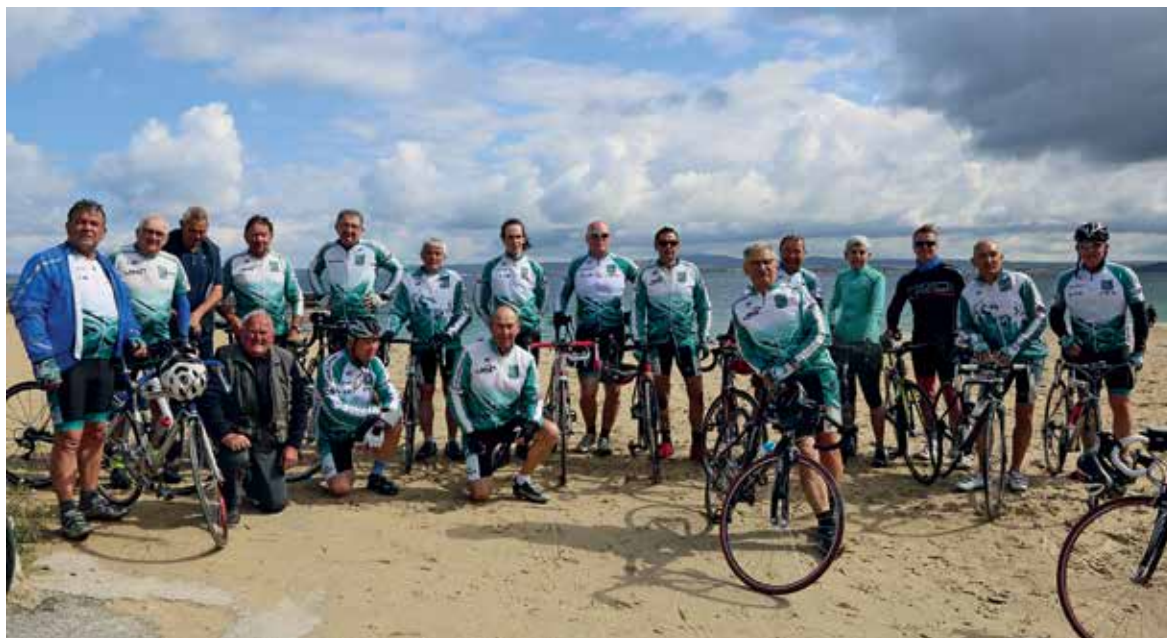
LE CYCLO-TOURISME Séjour à Douarnenez en mai