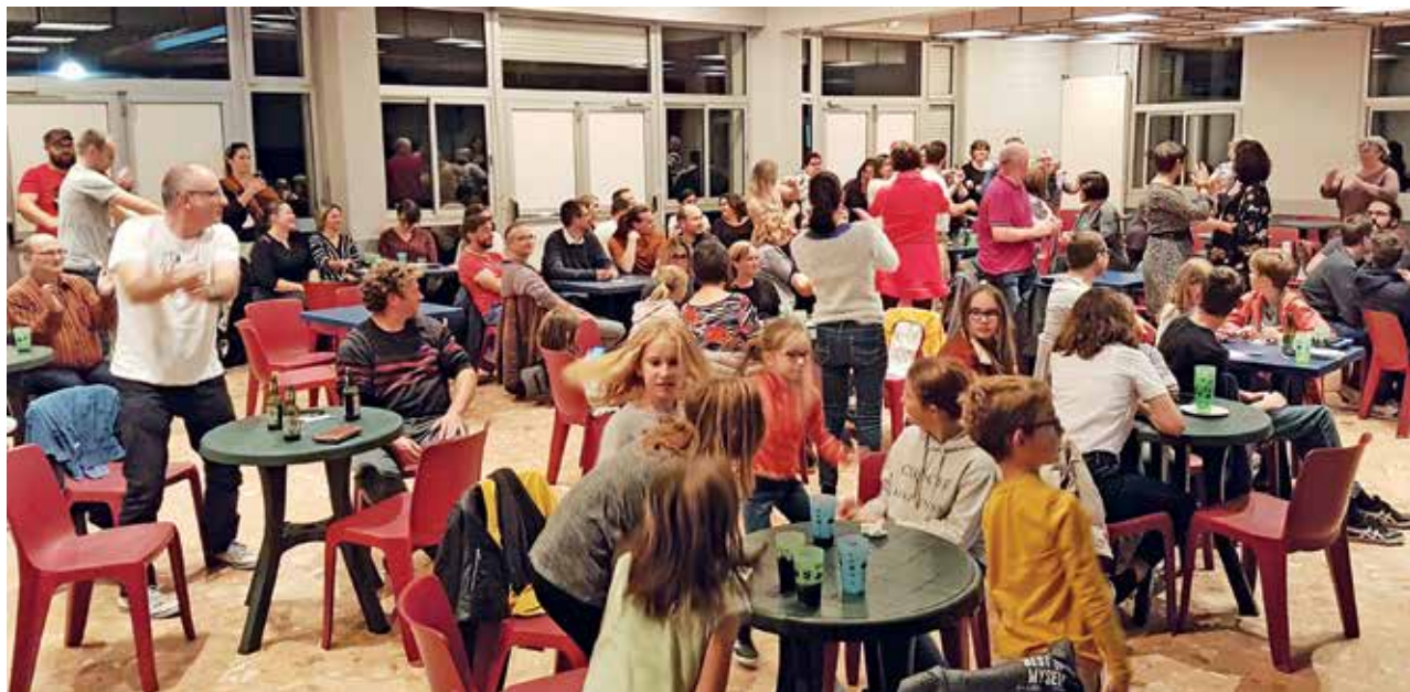
COMITÉ DES FÊTES Soirée quiz le 5 octobre