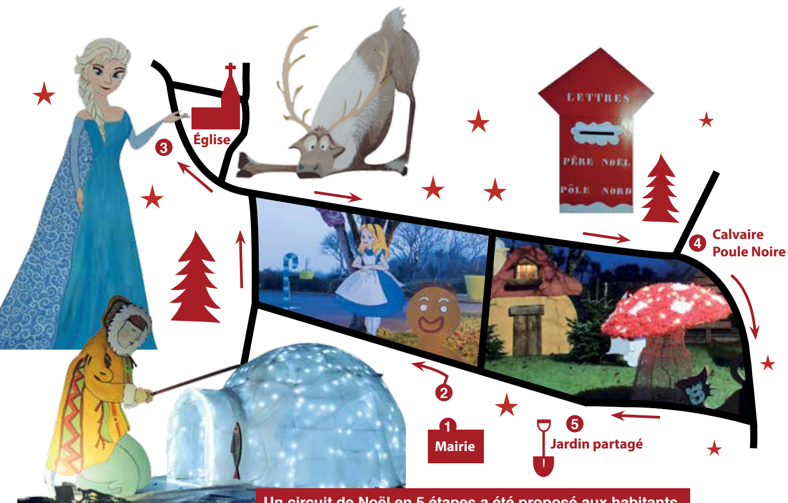
Un circuit de Noël en 5 étapes a été proposé aux habitants.

Tous les ans, ils ne manquent pas d'idées et consacrent de nombreuses heures de travail pour réaliser tous les décors que vous pouvez admirer dans notre commune. Merci à eux pour leur talent, leur disponibilité et leur motivation ! Cette année, les personnages de la Reine des Neiges ont célébré les fêtes de fin d'année sur la place de l'Église et les Schtroumpf ont rejoint la patinoire spécialement installée pour émerveiller les petits comme les plus grands. Nouveauté ! Une boîte aux lettres géante a pris place devant le restaurant scolaire et l'accueil périscolaire pour que les enfants puissent écrire au Père Noël qui leur a rendu réponse à tous !