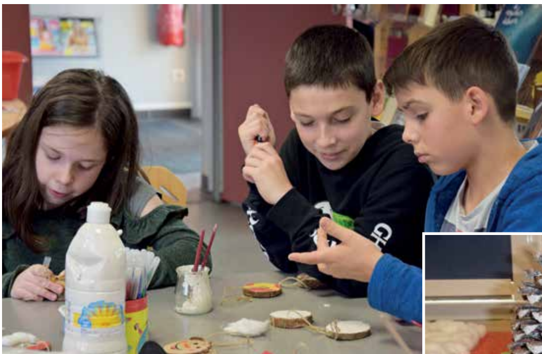
Ateliers décorations de Noël, les 20 novembre et 4 décembre