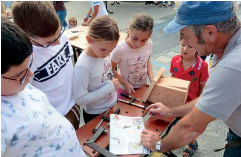
Atelier fabrication de nichoirs à mésanges avec l'association Terre d'Avenir, en septembre