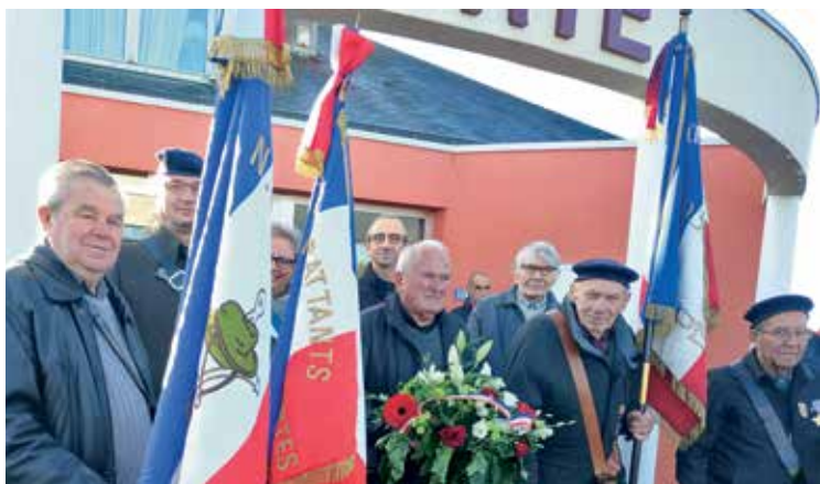
■ Commémoration du 11 novembre